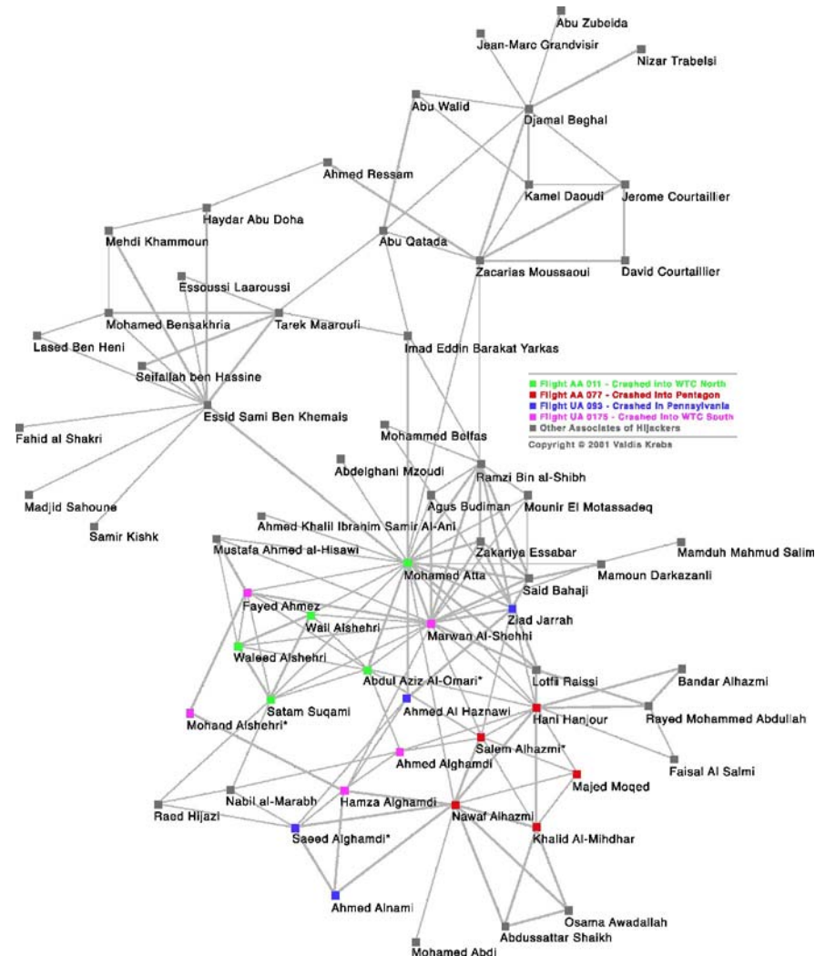
Figura 3: Red social en la que se muestran las relaciones entre los terroristas involucrados en los atentados del 11-S.

La estructura de Al Qaeda está constituida en grupos aislados, lo que minimiza la posibilidad de que la desarticulación de un grupo afecte a los restantes, que se comunican entre sí en circunstancias muy puntuales. Sin embargo, cada uno de estos grupos puede describirse mediante una red. En la figura 3, aparecida originalmente en [4], presentamos la representación en forma de red que hizo V. Krebs, un especialista en el estudio de redes sociales, de los terroristas involucrados en los atentados contra las Torres Gemelas. En esta representación se unen dos puntos (individuos) mediante un segmento cuando hay contacto entre ellos; la anchura del segmento de unión depende del tipo de relación entre los individuos y su intensidad. La información que se utilizó para realizar esta red se tomó únicamente de los medios de comunicación. De tres tipos de mediciones distintas que se pueden efectuar en este tipo de redes ( degree centrality , betweenness centrality y