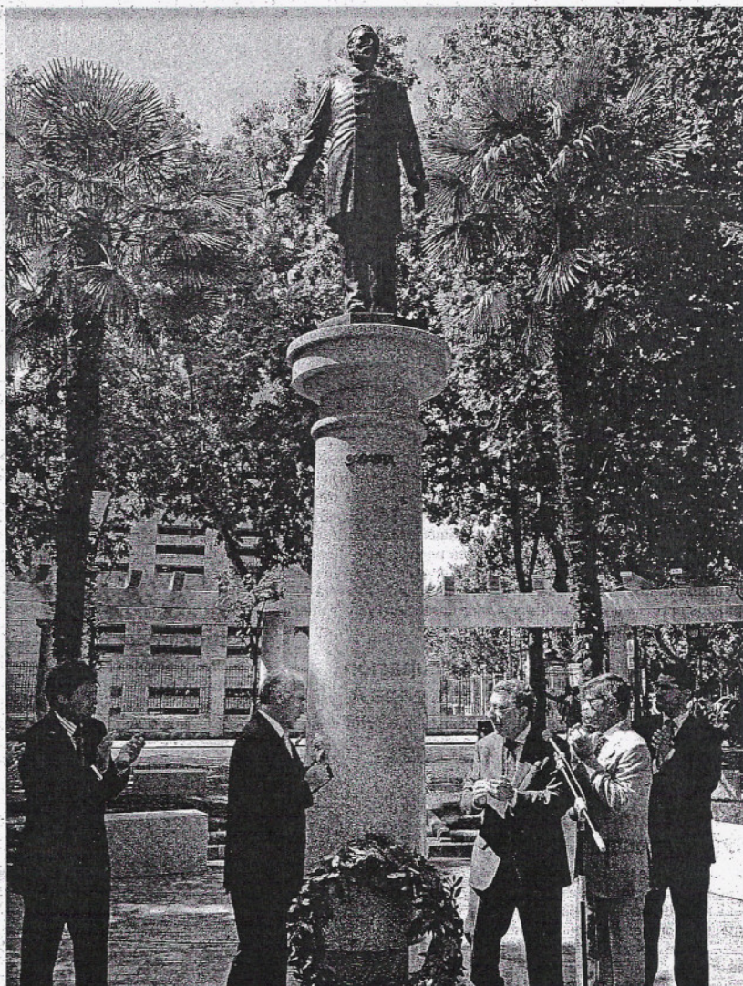
CORONA DE LAUREL. Aplausos tras la inauguración del nuevo pedestal.